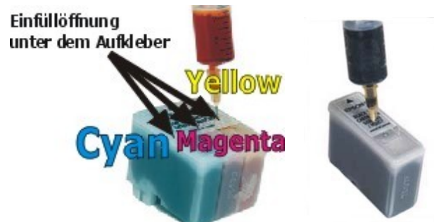
Stylus Color 400 / 500 / 600 / 800 850 / 1520

Für diese Drucker benötigen Sie einen Resetter