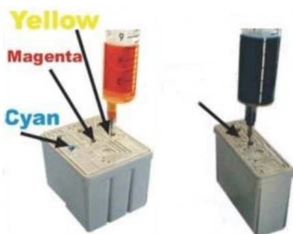
Stylus Color 440 / 480 / 580 / 460 / 640 / 660 670 / 740 / 760 / 860 / 1160 Stylus Scan 2000 - 2500