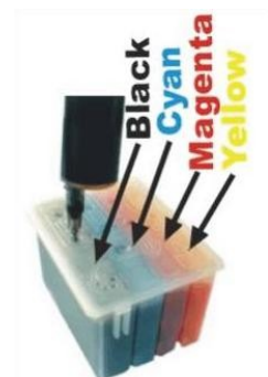
Stylus Color 300