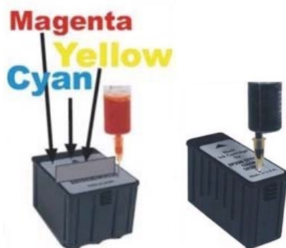
Stylus Color Pro / XL

Vor dem einsetzen Patronen ca 1-2 Stunden ziehen lassen.